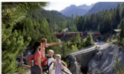
Entlang der Albulalinie

Auf der vierten Etappe von der Es-cha-Hütte SAC gelangt man nach kurzer Zeit zu einem einzigartigen Steinmannlipark, wo sich jedermann sein eigenes Steinmannli dazu bauen kann. Danach gelangt man, einen letzten Blick auf die spektakuläre Engadiner Berninagruppe werfend, über den Albulapass nach Bergün. Das Albulatal ist landschaftlich auch geprägt von der Rhätischen Bahn – ein kühnes Bauwerk, das vor über 100 Jahren erstellt wurde. Um 1860 bestand in Europa ein zusammenhängendes Netz von Haupt-eisenbahnen. Allerdings führte dieses nur bis zum Alpenrand. Erst die Erschliessung hoch gelegener Kurorte mit Schmalspurbahnen, wie sie 1890 zum Beispiel für Davos erfolgte, kennzeichnet den Beginn der breiten touristischen Erschliessung der Alpen. In diesem Zusammenhang ist auch der Bau der Albulalinie zu sehen. Gegenüber anderen Varianten, wie die der Scaletta- oder der Julierbahn, hatte die Albulalinie topografische und verkehrstechnische Vorzüge. 1890 konstituierte sich in Bergün ein Albulabahn-Komitee mit Persönlichkeiten aus Politik und Hotellerie. Auf der Basis dieser Initiative erfolgte 1898 der Baubeginn der Albulalinie. Heute ist die Rhätische Bahn auch eine Erlebnisbahn. In Bergün ist ein bahnhistorisches Museum in Planung; schon jetzt kann man sich über die Bahn auf einem Erlebnispfad informieren. Seit Juli 2008 zählt die Albula- und Berninalinie (von Thusis bis Tirano) zum UNESCO Welterbe. www.rhb.ch